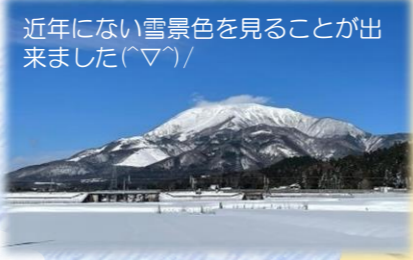
近年にない雪景色を見ることが出来ました(マ)！